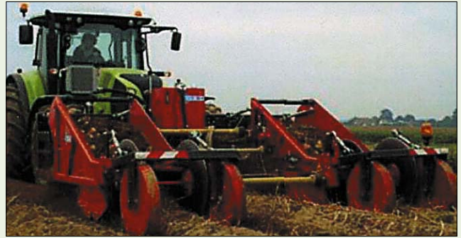
Рис. 7. Копатели для комбинированной уборки картофеля фирмы Tolmac B.V. в уборочном агрегате

Прицепной двухрядный элеваторный копатель-укладчик для раздельной уборки VR 3000 показала фирма AMAC (Нидерланды). Имеется четырехрядная модификация. Особенностью названных копателей стало применение гидропривода от трактора, что позволяет плавно изменять рабочий режим применительно к изменяющимся условиям уборки. На стендовом показе, по сравнению с предыдущими выставками данного направления, в меньшей степени предлагали технические средства для малых производителей картофеля. Ряд фирм, например Jabelmann (Германия), Schouten Sorting Equipment (Нидерланды), ранее представлявшие подобную технику, демонстрировали более крупные