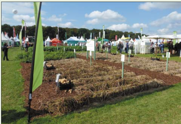
Рис. 2. Участок показа сортов картофеля

Экспозиция, как всегда, отличалась большим разнообразием. Значительное место в павильоне занимал широкий и наглядный показ разных сортов картофеля. Многие сорта были представлены также на полевых участках выставки (рис. 2).