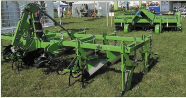
Рис. 6. Культиваторы фирмы AVR (Бельгия)

вала элеваторный копатель MT 14 для комбинированного способа уборки картофеля. Этот копатель, смонтированный попарно на переднюю навеску мощного трактора с обеих его сторон (рис. 7), позволяет использовать в соответствующих условиях прицепной двухрядный комбайн бункерного типа для уборки картофеля одновременно с четырех рядков.