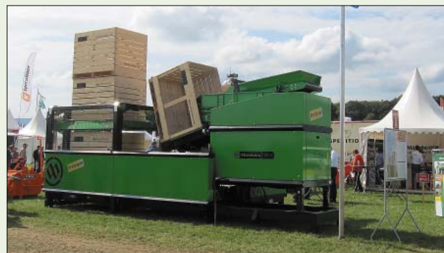
Рис. 5. Установка для затаривания евроконтейнеров

заполнения и опорожнения контейнеров на специальном участке, фирма Miedema – передвижную установку для затаривания картофеля в контейнеры (рис. 5).