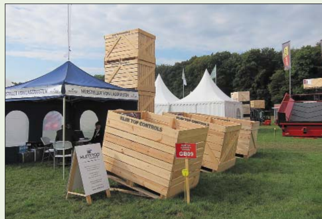
Рис. 4. Евроконтейнеры для картофеля

Особенность данного показа – большое количество стендов, представляющих евроконтейнеры или технические средства их применения. В набор оборудования для применения контейнеров входят технические средства для их перевозки, погрузки, мойки и обеззараживания. Так, наряду с показом на многих стендах контейнеров (рис. 4), фирма Grimme (Германия) демонстрирует комплекс техники для