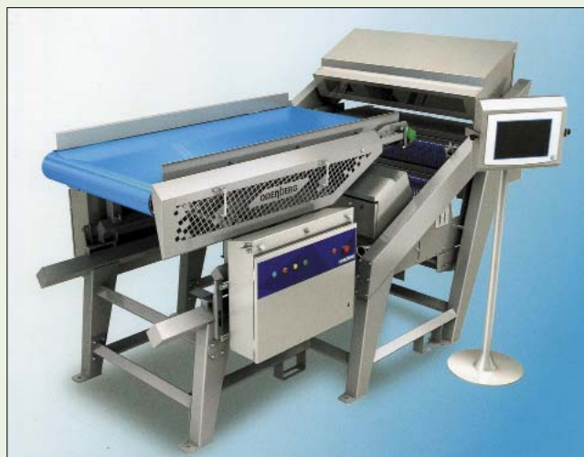
Рис. 3. Электронный сортировщик серии HALO

Одна из 4 моделей оптического сортировщика серии Halo фирмы Odenberg представлена на рисунке 3.