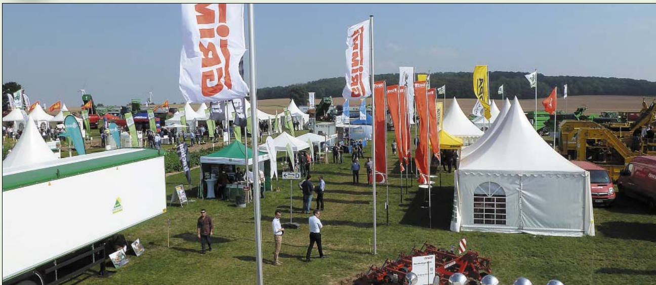
Рис. 1. Специализированная выставка по картофелеводству