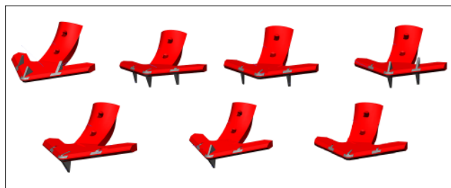
Рис. 3. Рабочие органы в различной комплектации

Выполнение рыхлителей и щелевателей с платформами под пазы лапы делает возможным переустановить рабочие органы по разным схемам (количеству и расположению рыхлителей и щелевателей) и таким образом изменять расстояние между обрабатываемыми полосами поля (рис. 3).