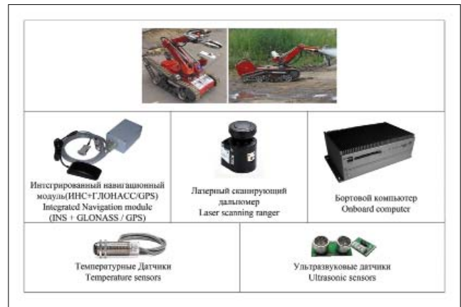
Рис. 3. Робототехнический комплекс Ориентир с комплектом модулей

Еще одним примером встраиваемых систем может служить система автоматического (программного) управления движением в составе ДУ РТК, также разработанная и сконструированная сотруд-