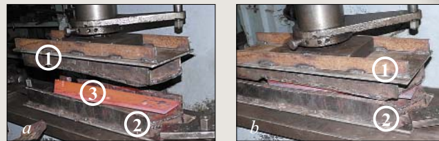
Рис. 3. Штамповка лемеха: а – положение перед работой; б – момент прижатия пуансона к матрице с заготовкой лемеха: 1 – пуансон; 2 – матрица; 3 – лемех

Наплавку проводили как на остове лемеха, так и на долоте с применением высокоскоростной плаз-