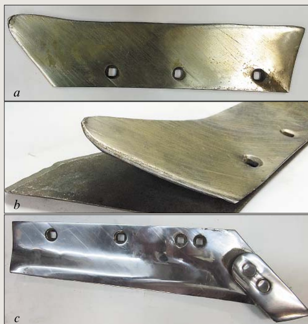
Рис. 6. Вид лемехов при пахоте тяжелосуглинистых почв (Владимирская МИС):

На тяжелых почвах – глинистых и тяжелосуглинистых – твердостью до 4 МПа и выше (данные Владимирской МИС) разница в ресурсе лемехов составила 2,7-3,2 раза; при этом наработка у опытных лемехов достигала 22-27 га/лемех, серийных – не превышала 9,7 га/лемех. Следует отметить, что опыт-