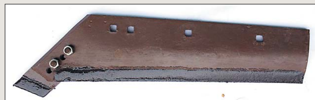
Рис. 4. Вид лемеха с тыльной стороны (наплавка выделена черным цветом)