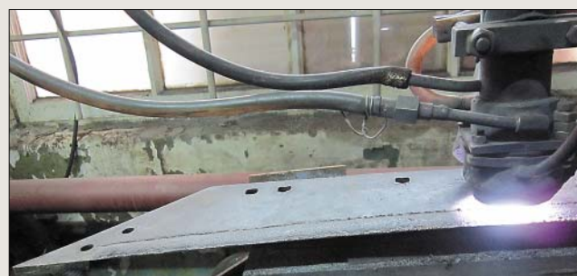
Рис. 5. Плазменно-порошковая наплавка лемеха